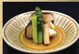
大椎茸のバターソテー